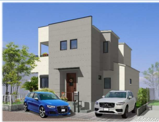
※イメージバスの為、実際と異なる仕上がりになる場合があります。

◆ 冬暖かく夏涼しい高性能ハイブリッド窓採用『サーモスL』（アル樹脂のハイブリッド構造・優れた断熱性）