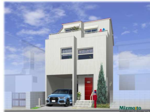
※イメージパースの為、車庫スペースと車のイメージ及び外観が実際と異なる仕上がりになる場合があります。

◆充実の防火性能で安心安全と快適さを両立した『エピソードII 防火窓GNEO』（網入複層ガラス・クリアネット採用）