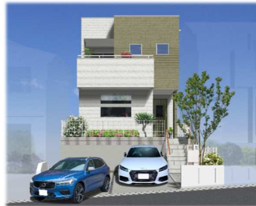
※イメージバスの為、車庫スペースと車のイメージ及び外観が実際と異なる仕上がりになる場合があります。