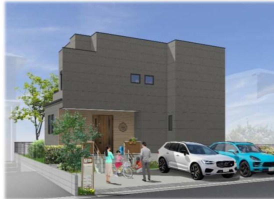
※イメージベースの為、実際と異なる仕上がりになる場合があります。