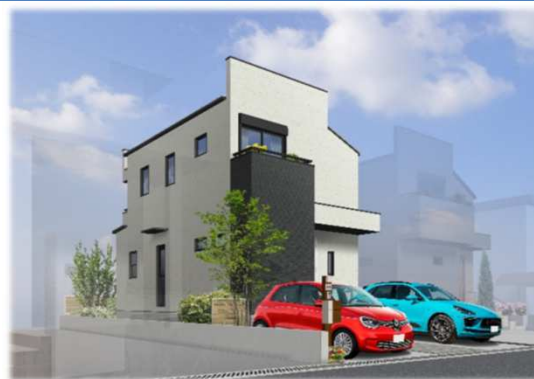
※イメージパースの為、車庫スペースと車のイメージ及び外観が実際と異なる仕上がりになる場合があります。

◆冬暖かく夏涼しい高性能ハイブリッド窓採用 『サーモスL』（アルミ樹脂のハイブリッド構造・優れた断熱性）