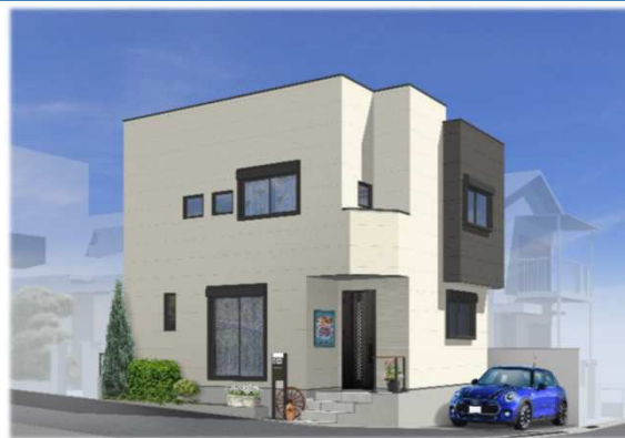
※イメージパースの為、実際と異なる仕上がりになる場合があります。

◆冬暖かく夏涼しい高性能ハイブリッド窓採用 『サーモスL』（アルミ樹脂のハイブリッド構造・優れた断熱性）