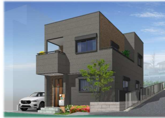
※イメージベースの為、車庫スペースと車のイメージ及び外観が実際と異なる仕上がりになる場合があります。