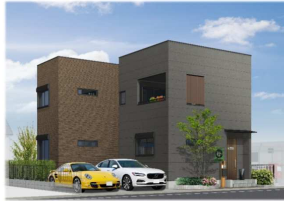
※イメージパースの為、車庫スペースと車のイメージ及び外観が実際と異なる 仕上がりになる場合があります。